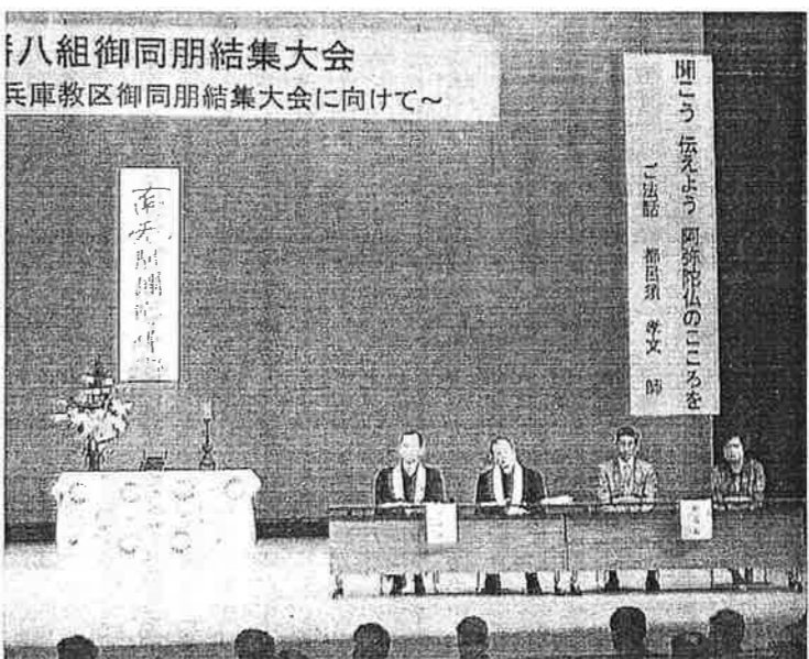
西播八組御同朋結集大会 兵庫教区御同朋結集大会に向けて～